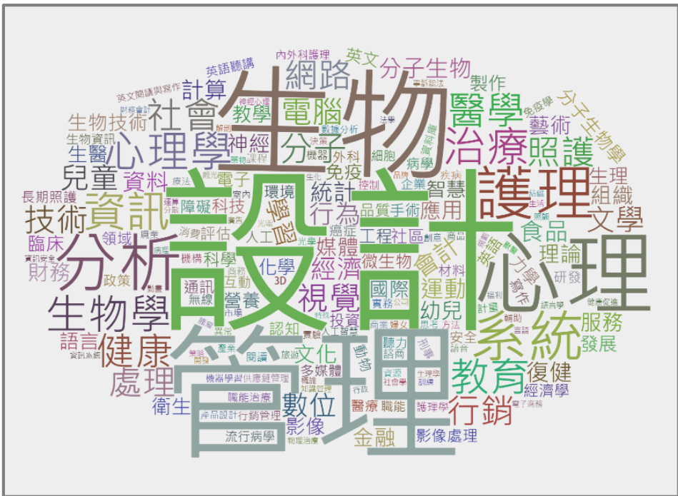
圖一：全校專任教師專長文字雲。